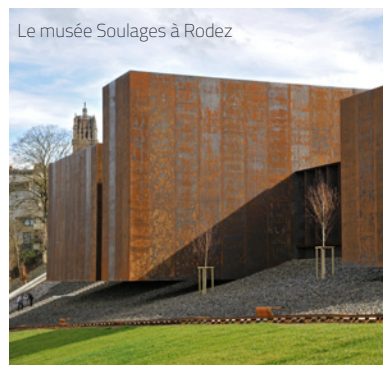
Le musée Soulages à Rodez