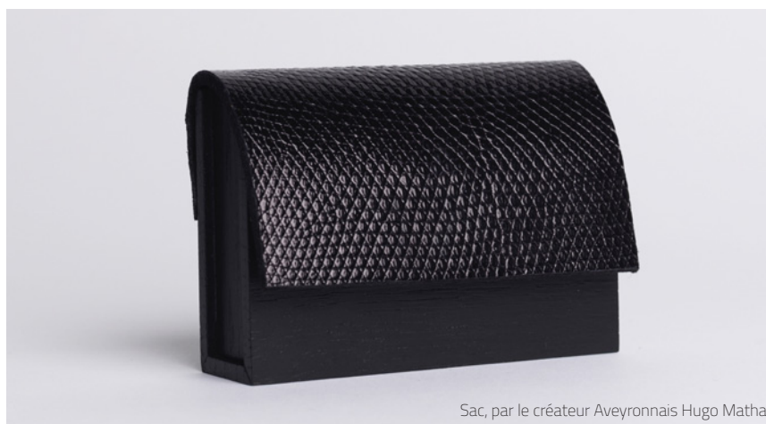
Sac, par le créateur Aveyronnais Hugo Matha