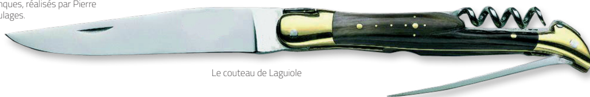
Le couteau de Laguiole