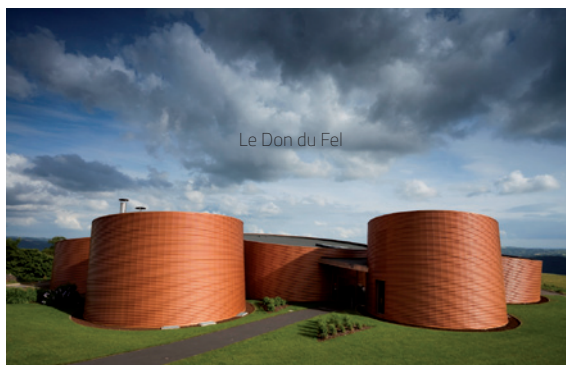
Le Don du Fel