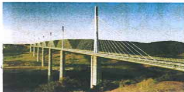
Het viaduct van Millau, in 2004 gebouwd over de Tarn, leidt naar de Middellandse Zee. Het is de hoogste brug ter wereld.

Florac ligt op de grens van de Cevennen en de Grands Causses. Die kalksteenplateaus zijn mogelijk nog onbekender dan de bergketen. Het gaat om vier dorre hoogvlaktes waar duizend keer meer schapen en geiten leven dan mensen. Kenmerkend voor deze hoogvlakten zijn de lavognes , kunstmatige drinkwaterreservoirs voor de kuddes. De ondergrond bestaat hier immers uit kalksteen, waardoor water er meteen in de bodem trekt. Dat verklaart ook de aanwezigheid van zoveel grotten, kloven en ondergrondse rivieren.