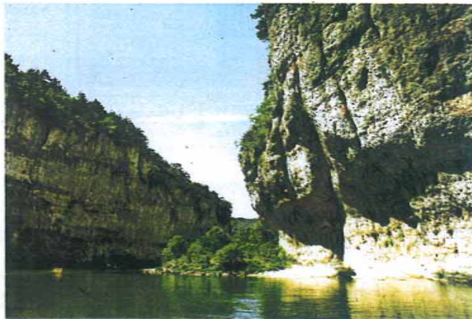
Aan de Gorges du Tarn loopt het water in een kloofdal tussen de kalksteenplateaus. In La Malène kan je 's zomers met een boot het smalste stuk van de rivier afvaren.

Trek ook tijd uit voor de andere canyons en de andere causses, want allemaal hebben ze hun eigen karakter. Zo kan je in de Gorges de la Jonte drie verschillende giersoorten observeren. Op de Causse Noire hebben water- en winderosie