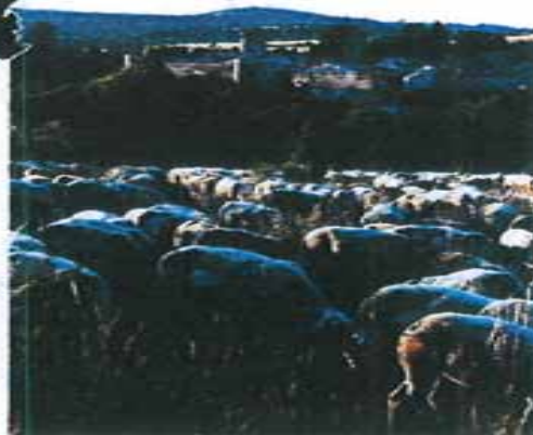
Schape grazen op het kalksteenplateau van Larzac. Op de achtergrond: het ommuurde dorp La Couvertolrade.

hectare is helemaal verboden terrein voor de mens. De natuur heeft hier vrij spel, er leven talloze bedreigde diersoorten en er groeien vele zeldzame planten. Industrie is er niet en het ruwe landschap is nauwelijks veranderd sinds 1878 toen de Schotse schrijver Robert Louis Stevenson te voet door de streek trok in het gezelschap van Modestine, een ezel met een eigen karakter. Vandaag kan je nog steeds in de voetsporen van Stevenson wandelen, mét een ezel als je wil. Te voet is trouwens de beste manier om het hart van het park te verkennen. Vooral de