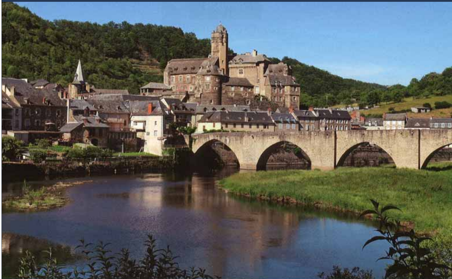
Het kasteel van (Valéry Giscard d') Estaing vanop de brug (begin 16de eeuw) over de Lot. Links de toren van de Saint-Fleuretkerk.

Gieren zweven cirkelend boven het park om neer te strijken op resterende botten en happen vlees, op gevaar af door een wolf gepluimd te worden.