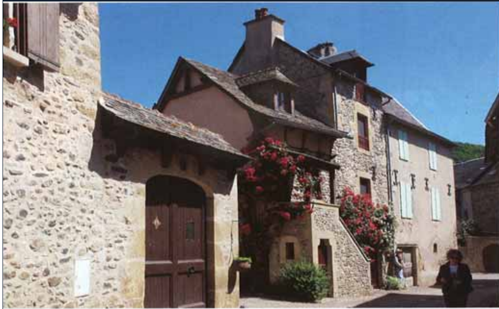
Sainte-Eulalie d'Olt, aan de poort van het voormalige klooster, straalt enkel rust en schoonheid uit.