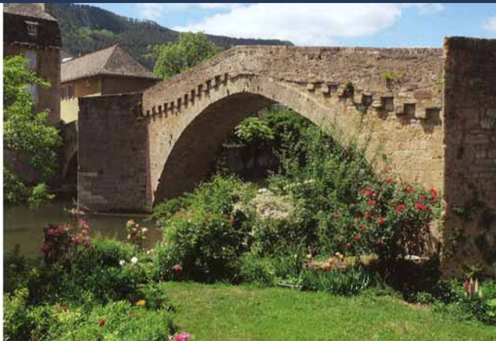
Mende, bisschopsstad en hoofdstad van het departement Lozère; de brug Notre-Dame uit de 13de eeuw houdt beide oevers van de Lot bij elkaar.