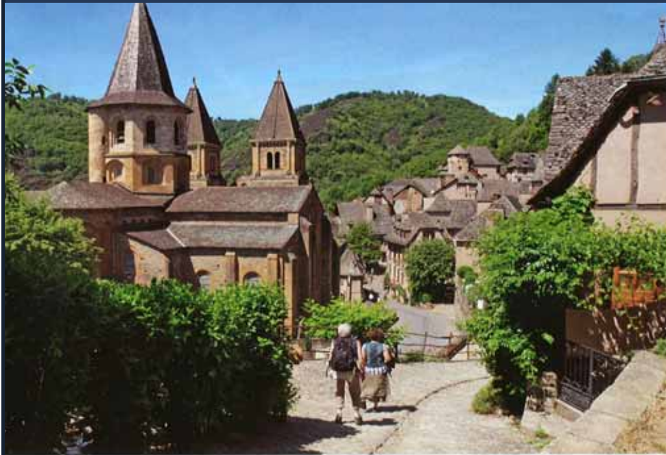
Hoogtepunt van romaanse architectuur op de Sint-Jakobsweg: de abdijkerk van Conques.