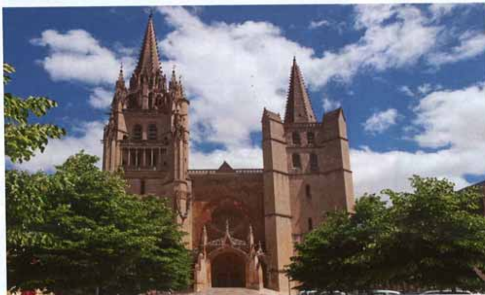
Verfijnde stoerheid van de kathedraal Notre-Dame te Mende.

Les Loups du Gévaudan, een wolvenpark (20 ha) in het gehucht Sainte-Lucie bij Saint-Léger-de-Peyre, biedt een panoramische blik over de Val d'Enfer. Daar leven een 130-tal wolven uit onder meer Mongolië, Siberië, Polen, Canada en Arctica in semivrijheid, want er blijft natuurlijk de omheining van het park. Aanbevolen is een rondgang met gids die je de verschillende wolfensoorten en hun sociaal leven beter leert kennen. Er is het zuchten, roepen en huilen van de wolf. Bij confrontatie met een wolf neem je best een positie aan op zijn niveau en niet hoger omdat de wolf moeilijk dominantie aanvaardt. 't Is maar dat je het weet.