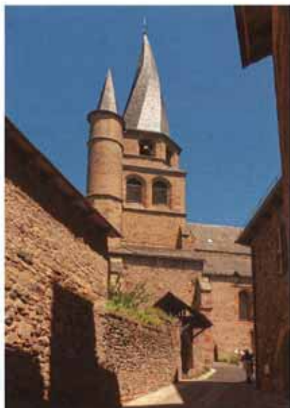
In Saint-Côme d'Olt wijst de gotische kerk met haar gedraaide toren frivol naar de hemel.