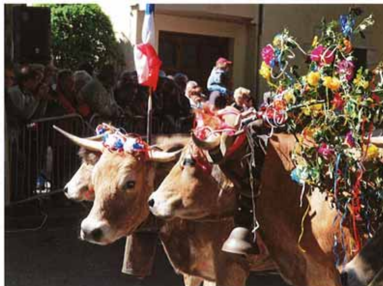
Klaar voor de jaarlijkse 'transhumance' (Saint-Geniez d'Olt).