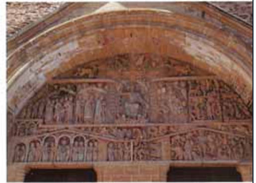
Het timpaan van de abdijkerk Sainte-Foy van Conques.