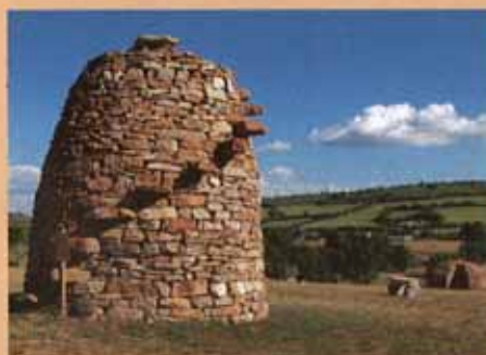
'Le Sentier du Berger': Dit is 'la tourelle', een van de schuilhutten met buitentrapp en zijte bovenaan, zonder specie in elkaar gepuzzeld, in het landschap van Sévérac-le-Château. Achteraan 'l'arruc', een ander type schuilhut.

Uitrit 42, Aire de l'Aveyron/Sévérac-le-Château. Net voor het tankstation leidt een weg je naar een vlakte met een nieuwsoortig openluchtmuseum. Verschillende types schuilhutten voor schaapherder en hond, zijn hier vakkundig opgetrokken zonder specie, in de stijl van vroeger, met of zonder buitentrapp, uitkijktorentje, slaapstede, windvang, enz. Verder een dolmen, veldkruis en muurtjes die erosie van het terrein moeten tegengaan. Het project is het werk van een veertigtal gepassioneerde vrijwilligers die dit architecturaal patrimonium willen bestendigen. Het 'pad van de schaapherder' illustreert eveneens hoe roquefort uit geitenmelk gewonnen wordt, van vitaal belang in de streek daar. Meer dan een halte waard.