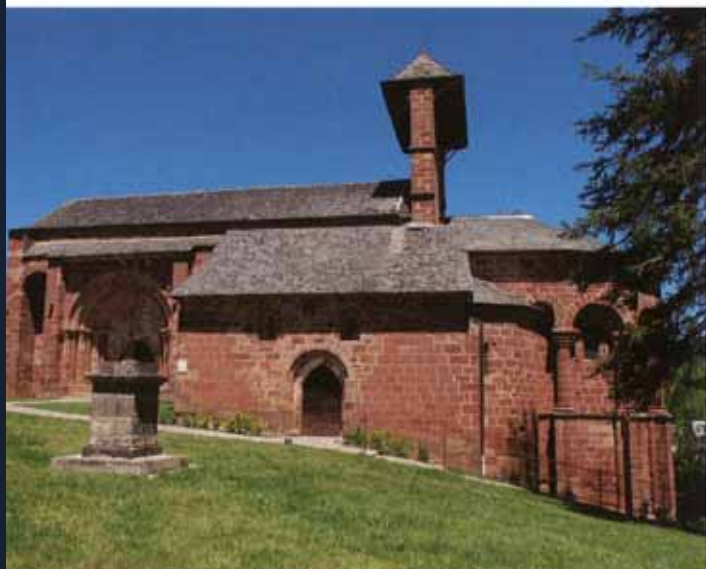
De mysterieuze, maar wondermoole romaanse Eglise de Perse in Espalion.