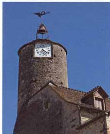
De Tour de l'Horloge in La Canourgue.

We zoeken het kleine weggetje, net breed genoeg voor een kampeervagen, naar Capelle-Bonance. Zo raken we op de D2 die ons naar Saint-Geniez d'Olt brengt. Opnieuw worden we