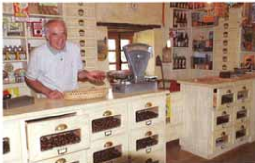
Het winkeltje van het Maison de la Châtaigne in Mourjou.

In Mourjou is de kastanje koning. Het Maison de la Châtaigne herbergt een bevattelijk