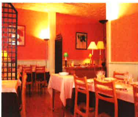
Hôtel Restaurant des Voyageurs

Avenue d'Aubrac 12470 Saint Chély d'Aubrac Tél : 05 65 44 27 05 www.hotel-conserverie-aubrac.com