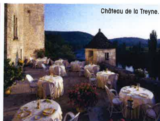
Château de la Treyne.