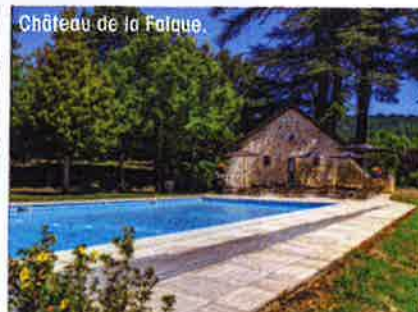
Château de la Falque.

APRÈS LE VERNISSAGE ? Le Château de la Falque. Couvent puis pensionnat de jeunes filles avant d'être un hôtel de charme, le lieu respire la quiétude. Il compte 10 chambres baroque, design