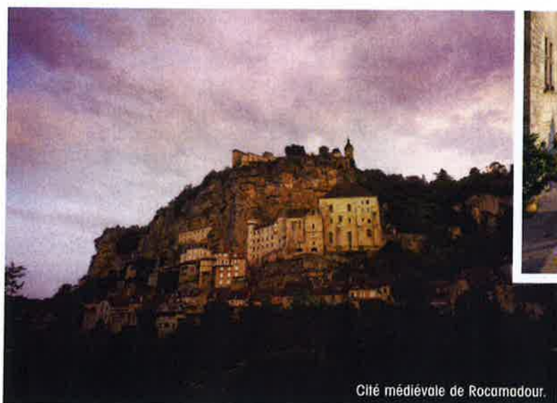
Cité médiévale de Rocamadour.