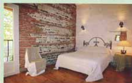
Recette de L'Éripodelle à Mondonville en Haute-Garonne