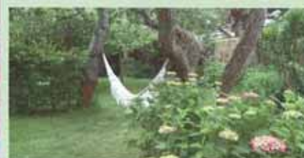
à la Maison du Chardon Bleu à Ploemeur dans le Morbihan