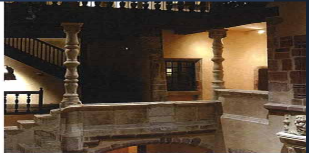
Rodez, Musée Fenaille. Musée Fenaille

★ Musée des Arts et Métiers (musée du Rouergue) - ☎ 05 65 67 28 96 - www.aveyron-culture.com - juil.-août : 10h-12h30, 13h30-18h30, w.-end et lun. 13h30-18h30 ; mai-juin et sept. : 11j sf mar. 14h-18h ; avr. et oct. : dim., merc. et jeu. 14h-18h - fermé nov.-mars - 4 € (enf. 2,50 €). 👤 Le musée est installé dans